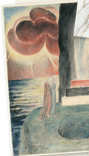
Sandro Botticelli Dante és Beatrice a Paradicsomban - részlet