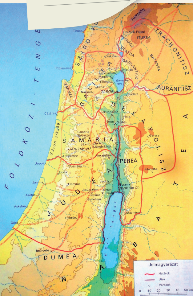
A Szentföld Jézus korában

Születés. A leírások szerint Máriának és Józsefnek útra kellett kelniük. Északról, Galileából utaztak a Jeruzsálemtől délre, soknapi járóföldre fekvő Betlehembe, mivel József családja idevalósi volt, s az adózási nyilvántartás miatt itt kellett bejelentkezniük. Csakhogy a szállások tele voltak, végül csupán egy istálló maradt számukra. Itt született meg Jézus, akit édesanyja az állatok etetésére szánt szalmára, jászolba fektetett. Milyen érzés lehetett Máriának azt átélni, hogy ennyire érzéketlenek, ridegek az emberek körülötte?