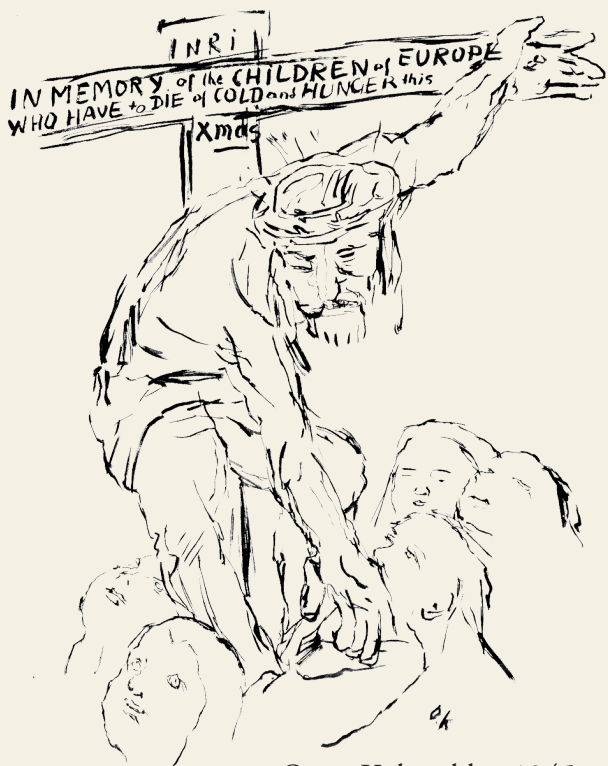
Oscar Kokoschka, 1945